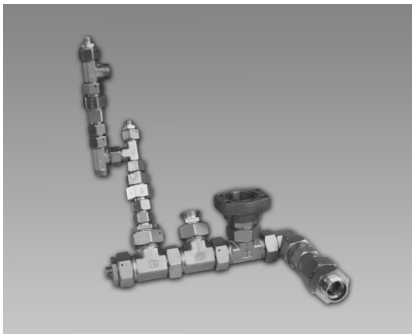
1. Situatie klant

Hooggekwalificeerde en ervaren engineers ontwikkelen continue nieuwe processen, in samenspraak met de klant, om conventionele en dure producten te vervangen.